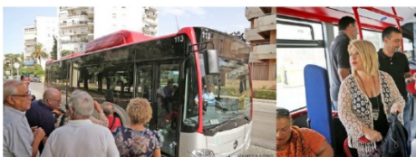
Varias personas esperan para acceder a un autobús nuevo ayer en el parque de El Herito

En concreto, estos primeros nueve autobuses Mercedes modelo Gitaro funcionan propulsados mediante gas natural comprimido y tienen una potencia de 3.000 cv, miden 12,1 metros de longitud y destacan por ser "muy accesibles, más silenciosos y más ergonómicos que los anteriores". Según detalló ayer el Ayuntamiento, tienen capacidad para transportar hasta 92 personas (25 de ellas en asiento). Estos nueve han sido financiados con fondos europeos mediante la Estrategia de Desarrollo Urbano Sostenible Integrado (Edusi), una actuación cofinanciada por la Unión Europea mediante el Programa Operativo de Crecimiento Sostenible Feder 2014-2020.