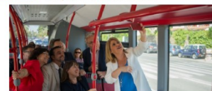
El equipo de gobierno se hace un 'belle' en uno de los nuevos autobuses presentados en junio pasado.

LAVOZDELSUR.ES • 26 DE JUNIO, 2018 • 3 MINUTOS EN LEER