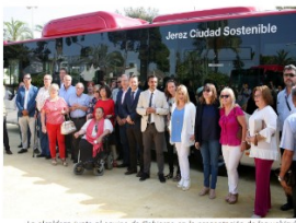
La alcaldesa junto al equipo de Gobierno en la presentación de los vehículos

La regidora ha enfatizado que "son los autobuses que Jerez merece", refiriéndose expresamente a la calidad de los 9 vehículos, sobre los que ha destacado que "son vehículos sostenibles, de máxima calidad, más accesibles y más económicos, porque funcionan con Gas Natural Comprimido y con la garantía de una marca líder como es Mercedes". "Dan respuesta al compromiso del Gobierno con Jerez", ha dicho.