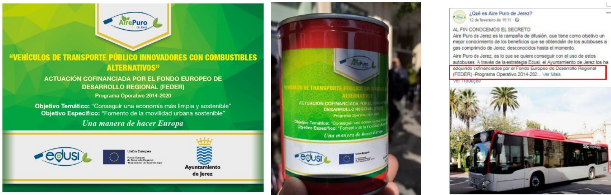
Flowerpot sticker and 6 x 2m Roll Up:

The FEDER co-financing legend is printed on each tin/plant pot, along with the EU flag, a specific web address and an App or Mobile Web: http://airepurodejerez.es/