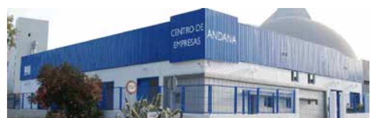
Vivero municipal de empresas Andana, situado en el Polígono Industrial El Portal

Además de suelo para actividades económicas, la ciudad dispone de una amplia oferta de viveros de empresas (Centro de Empresas Andana, Centro Europeo de Empresas e Innovación - CEEI, Centro CADE de la Fundación Andalucía Emprrende), centros de negocios públicos (Centro de Negocios San Agustín-Zona Franca) y privados, así como espacios de coworking.