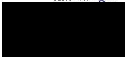
Delegado de Deportes y Medio Rural Ayuntamiento de Jerez