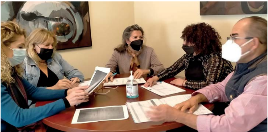
Oficina Técnica del Distrito Sur

Igualmente se realiza asesoramiento al Voluntariado y se ofrece información de las actividades organizadas desde el Proceso Comunitario.