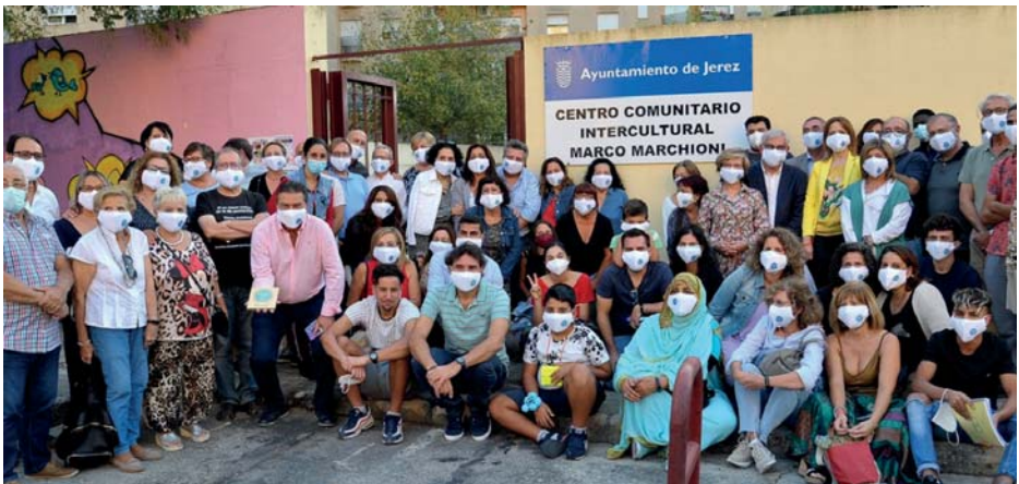
"Centro Comunitario Intercultural Marco Marchioni"

Además este centro es un espacio para la relación, el encuentro, la formación y capacitación de la ciudadanía. Un espacio de mediación y de promoción de la participación y la convivencia. Así como un espacio para fomentar la creatividad y la innovación social, potenciando el dialogo de saberes, la gestión de la diversidad y la equidad.