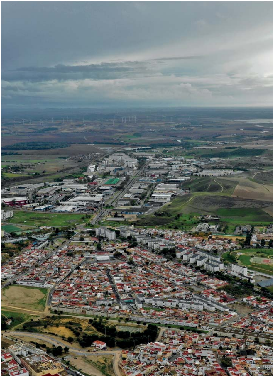
Vista aérea del Distrito Sur de Jerez