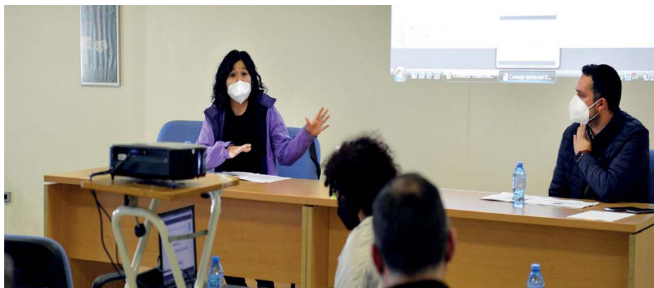
Constitución del Consejo Territorial del Distrito Sur