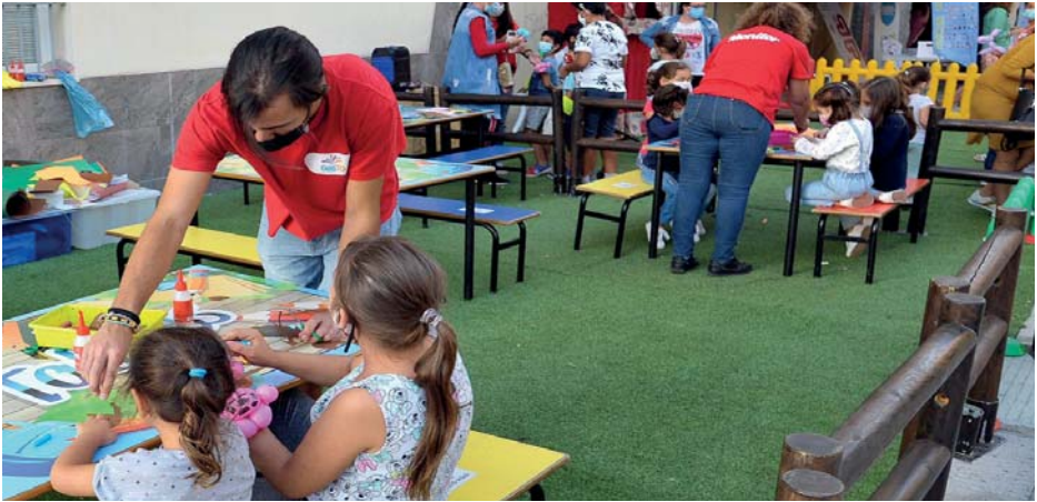
Actividades infantiles, en un centro educativo del Distrito Sur