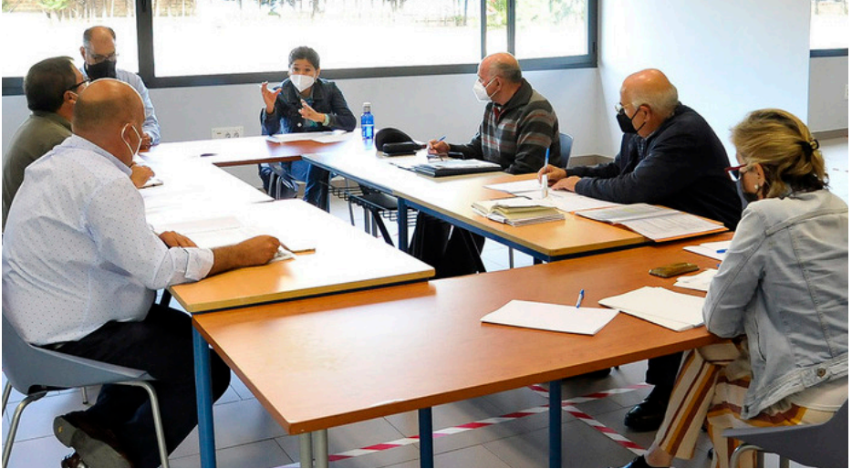
Reunión del Consejo Territorial del Distrito Este