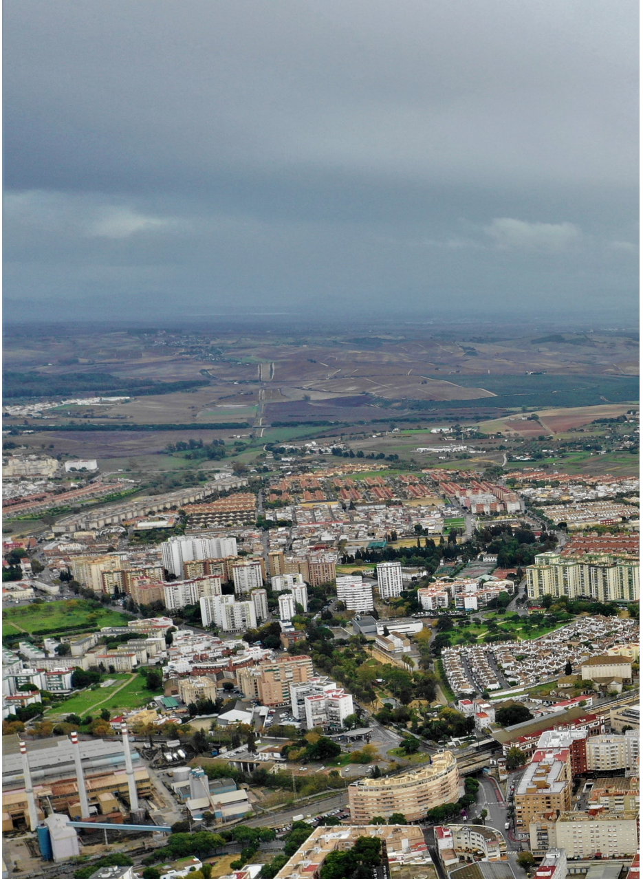
Vista aérea del Distrito Este de Jerez