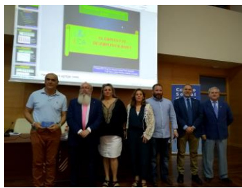
Sesión Empleo y Desempleo