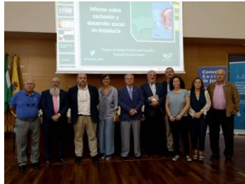
Sesión II Informe FOESSA