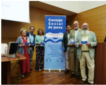
Sesión Desarrollo Rural