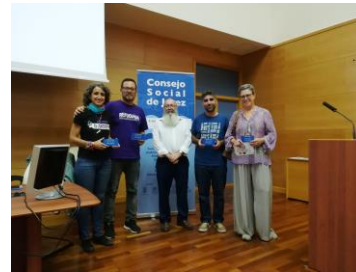
Sesión Integración Social